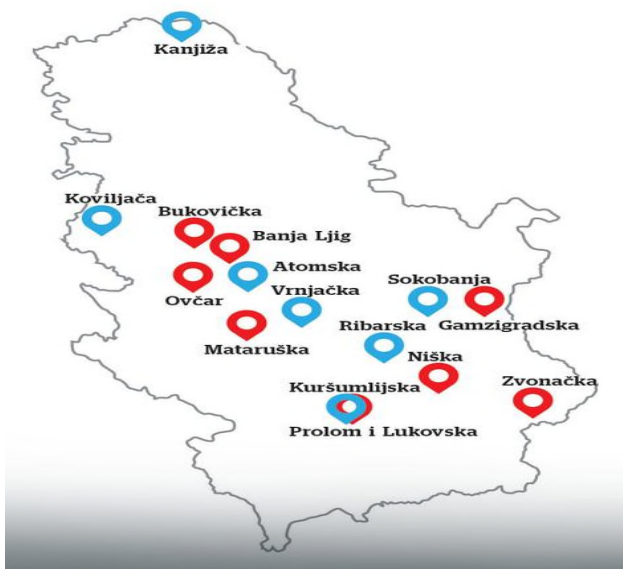
Слика 1. Географски приказ бања у Србији

Косовској зони припадају: Клокот Бања код Урошевца и Илица код Пећи.